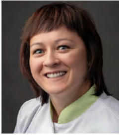
G. Fulminis Fachfrau Betreuung