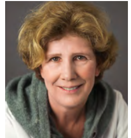
A. Kofel Pflegefachfrau DN I