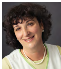
C. Tomo Haushelferin